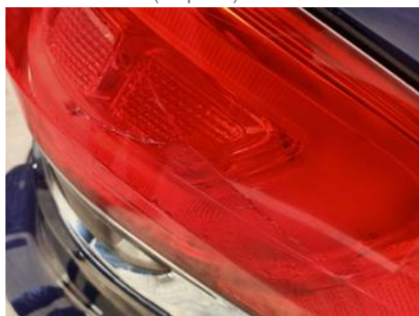
Phare arrière droit (Impact)